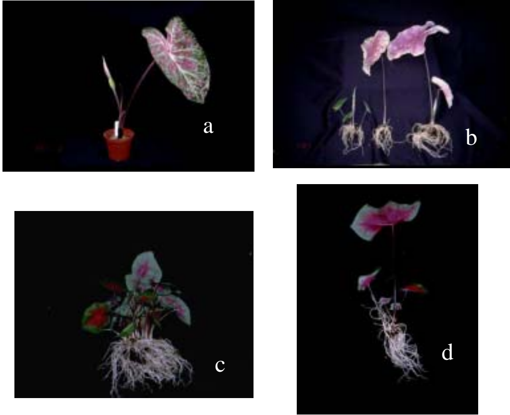
圖 2 彩葉芋不同品種塊莖的出葉情形