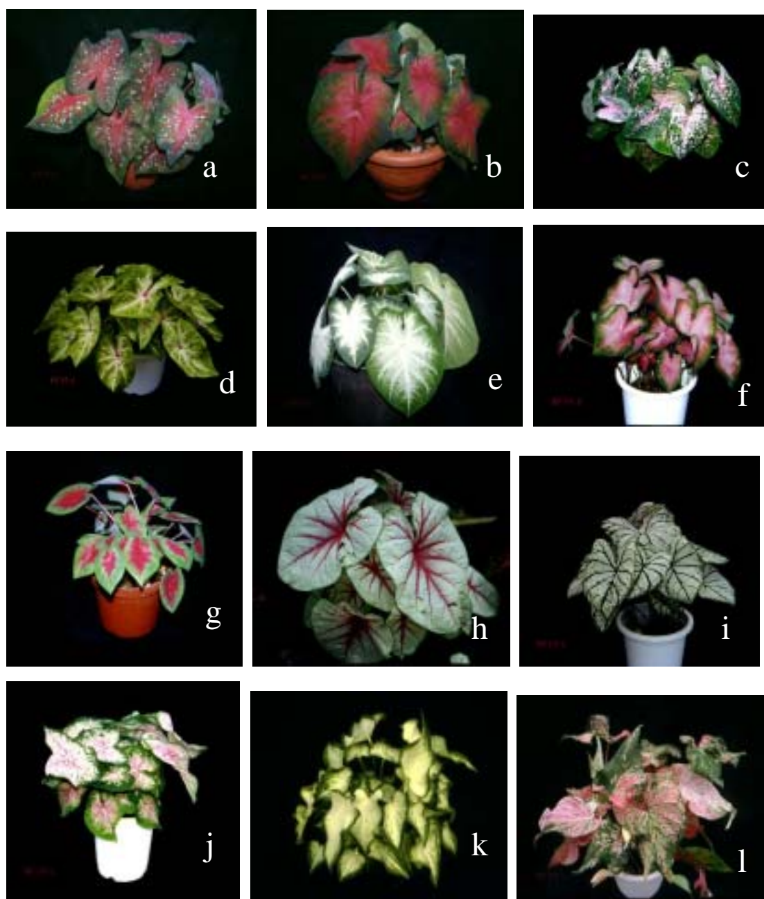
圖 1 不同品種的彩葉芋